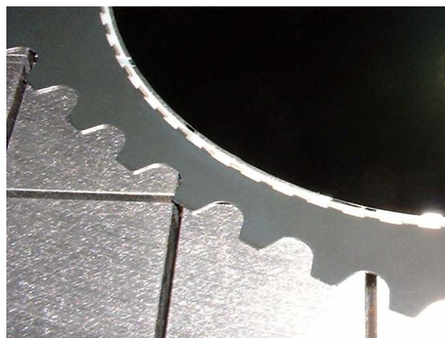
Choose from over 20 thicknesses of custom spring or stainless steel.

PR Hoffmanのインサートキャリアは長持ちするポリマーの登録商標のグレードとブレンドによって成形されています。当社は多数のカスタム素材をご提供しており、またお客様の特定のニーズにお答えする様々な新しい素材を常に開発しています。