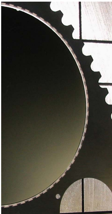
Photograph of 200 mm Insert Carrier and silicon wafer.